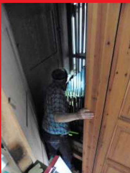
Terugplaatsen van het pijpwerk