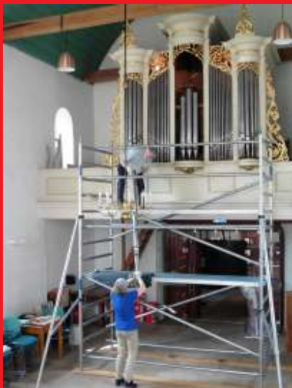
Demontage frontpijpen van de prestant.