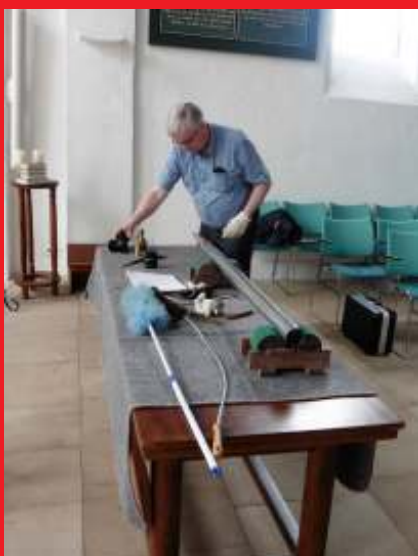
De werkplaats in de kerk. Hier werd al het pijpwerk nagekeken, schoongemaakt en gerepareerd waar nodig.