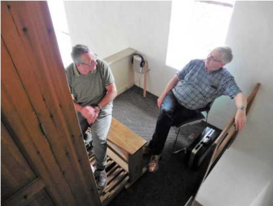
Discussiëren over de te vormen klank