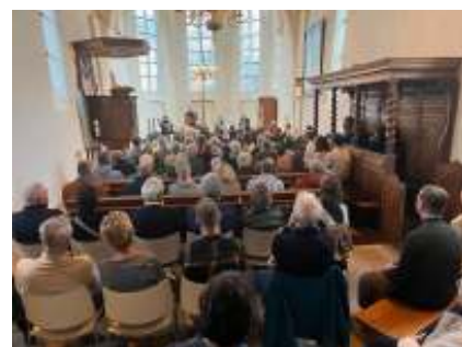
Volle bak op 17 november bij optreden tBS