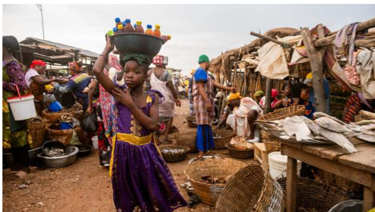
Collecte 8 december: Werelddiaconaat Ghana

Door heel Nederland heeft het Leger des Heils zo'n honderddertig buurthuis kamers. Plekken voor en door de buurt, waar iedereen welkom is. In deze buurthuis kamers kunnen mensen terecht voor een kop koffie, een maaltijd, een goed gesprek, zingevingsvragen of bijvoorbeeld tweedehands kleding. Kortom: een plek waar je thuiskomt.