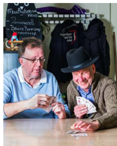
Collecte 24 december: Leger des Heils, Buurthuis kamers