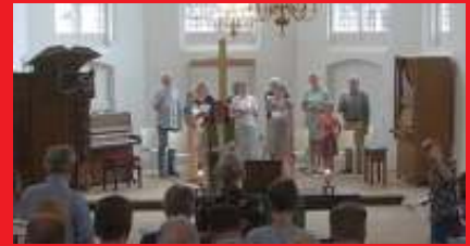
de cantorij op de Startzondag