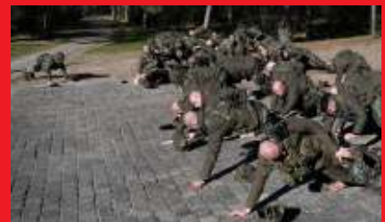
Dreigt er oorlog?